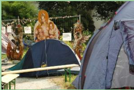
Seit Sonntag, 22 Uhr, campieren AktivistInnen am Augartenspitz.